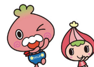
川島町マスコットキャラクター 「かわべえ、かわみん」